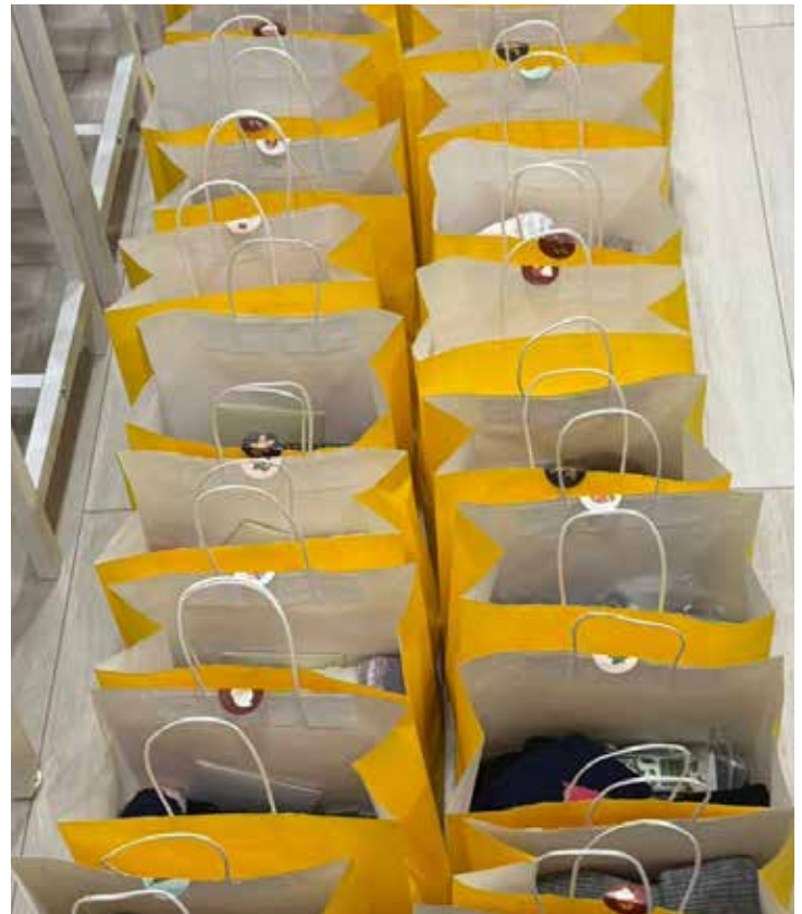
Sacolas foram entregues no mês de dezembro

As doações puderam ser feitas até o dia 1º de dezembro e foram coordenadas por Aline Foligno e Flora Sofia, que são responsáveis pelos