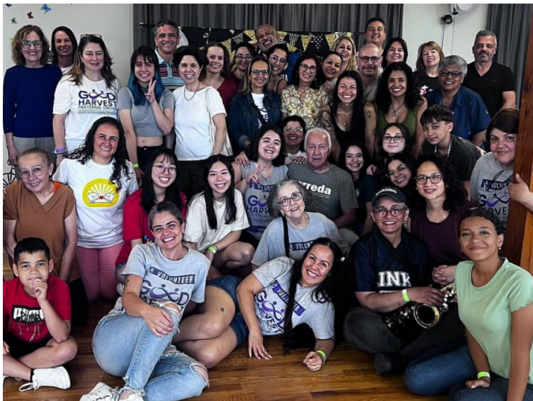
Casa oferece ensinamentos da Doutrina e atendimento comunitário