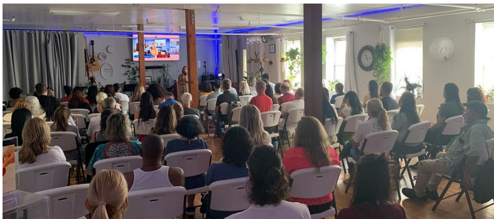
Grupo Fraterno recebe em média entre 100 e 120 pessoas por semana