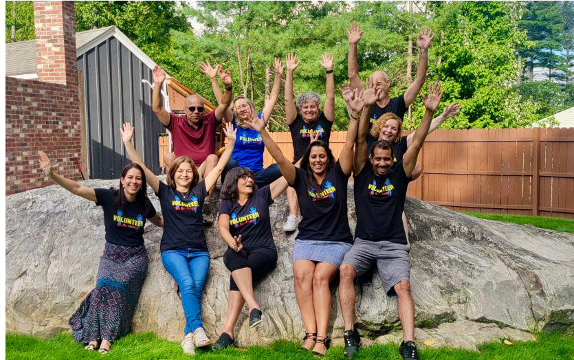
Encontro realizado em 2022 reuniu turma animada

Confraternização visa reunir quem atua nas causas sociais da instituição