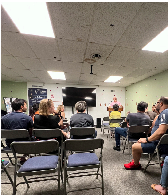
Alunos recebem certificados ao final de cada curso

Depois, os que tiverem interesse em se aprofundar podem ainda participar dos cursos do Instituto