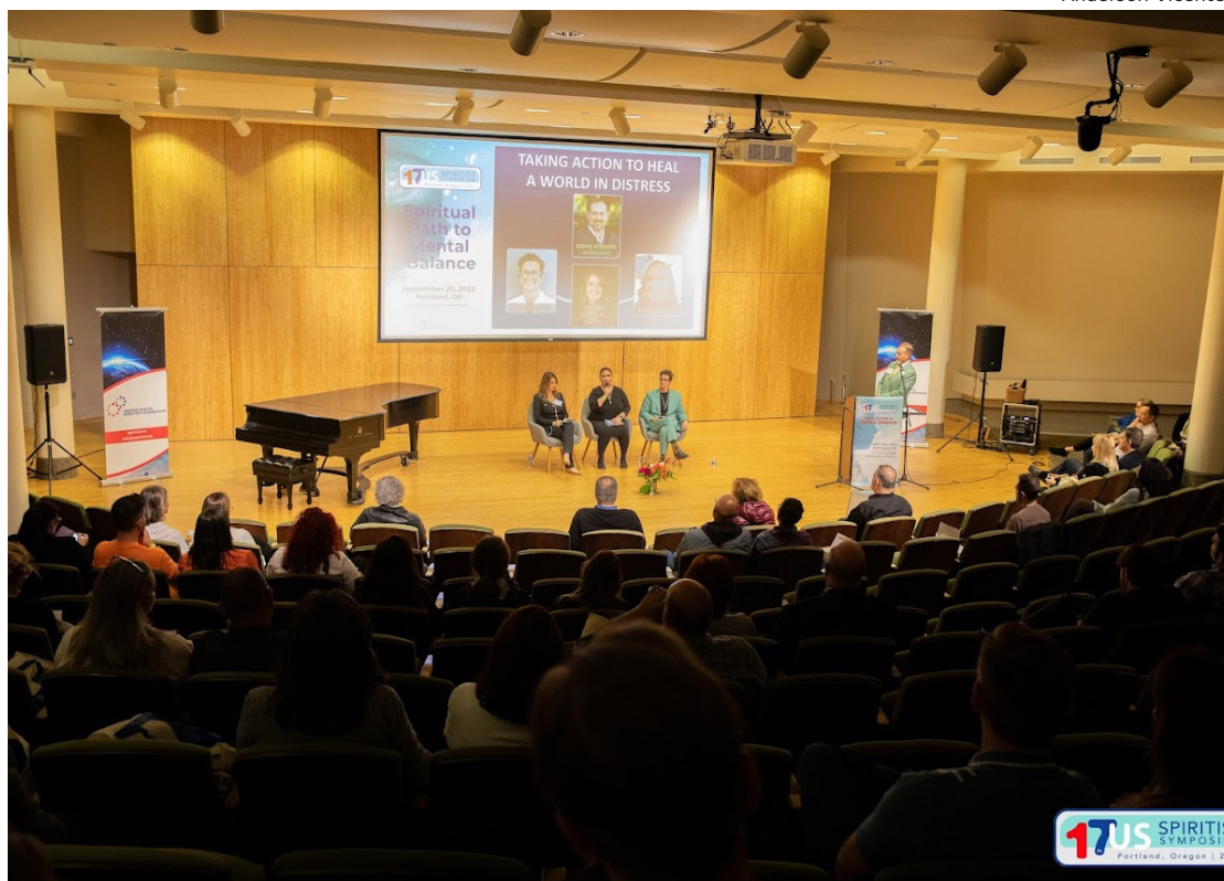
A 17ª edição do simpósio ocorreu em Portland, Oregon, no ano passado